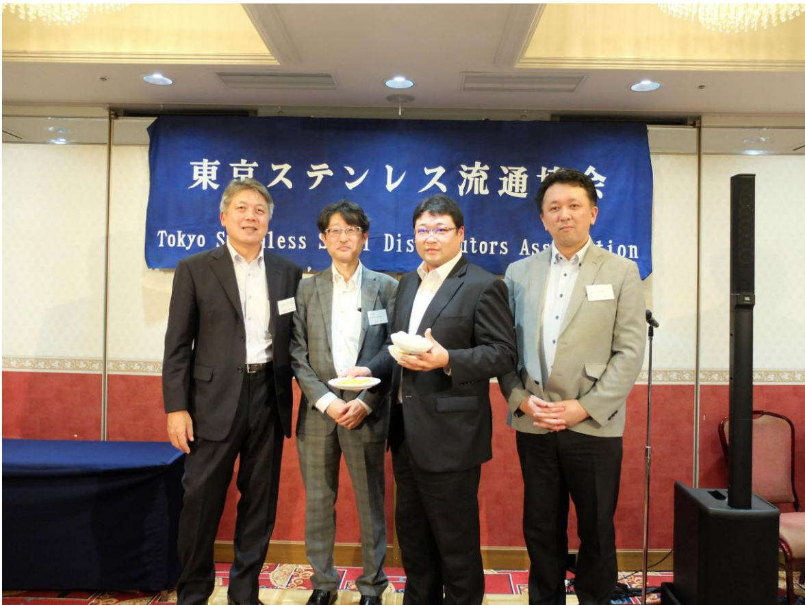
団体優勝 伊藤忠丸紅特殊鋼(株)Aチーム