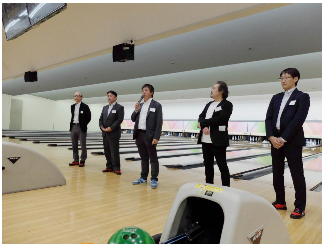
池田体育厚生委員長による開会の挨拶