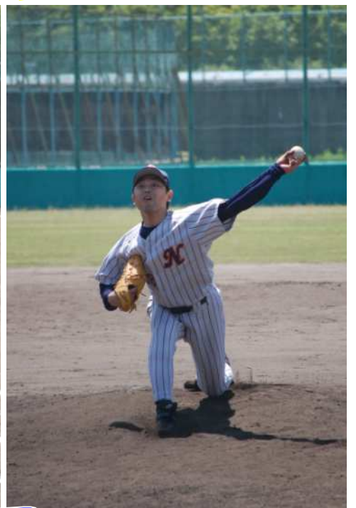
早くも好プレー、珍プレー続出