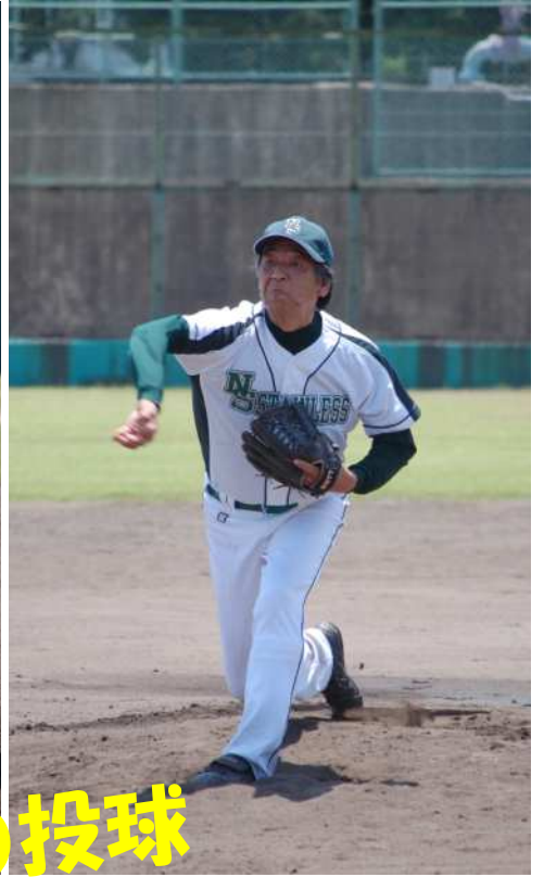
勝利に向けて入魂の投球