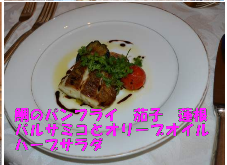
鯛のパンフライ 茄子 蓮根 バルサミコとオリーブオイル ハーブサラダ