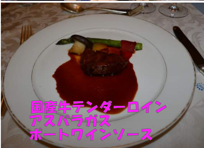
国産牛 tenderloin アスパラガス ポートワインソース