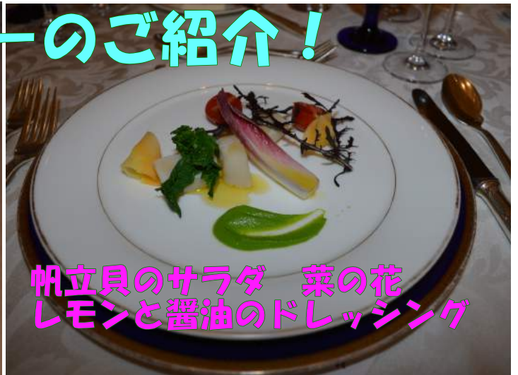
帆立貝のサラダ 菜の花 レモンと醤油のドレッシング