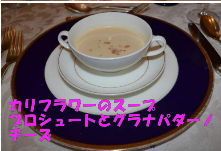
カリフラワーのスープ フロシュートとグラナパダーノ チーズ