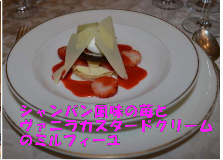
シャンパン風味の苺と ヴァニラカスタードクリーム のミルフィーユ