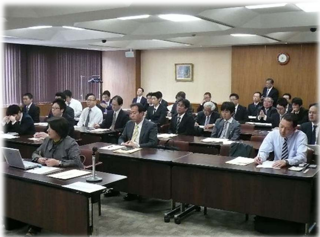
組み合わせ抽選会場