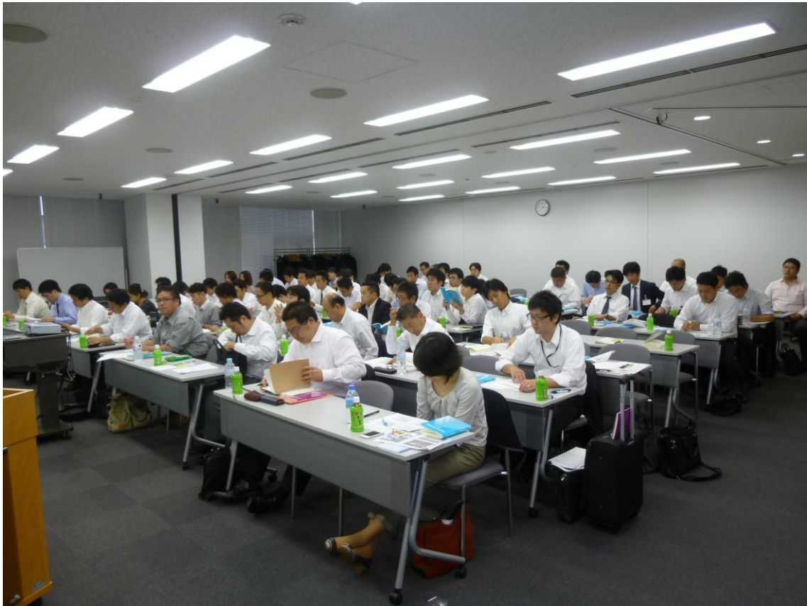
ステンレス鋼販売技士検定研修講座 東京会場（明治大学紫紺館）