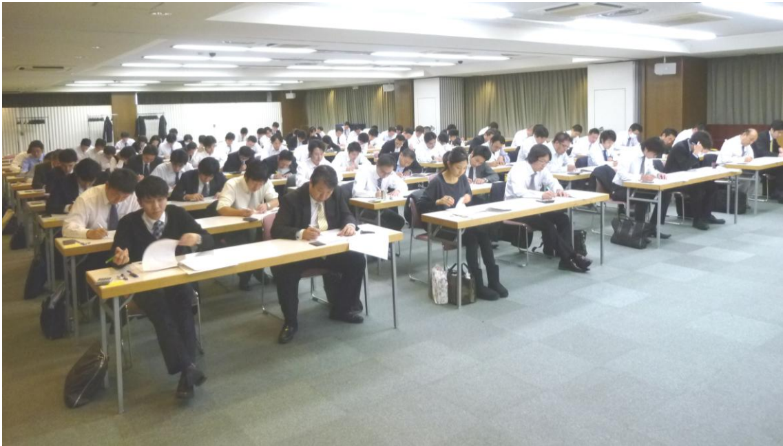
ステンレス鋼販売技士検定試験 東京会場（鉄鋼会館）

合格者の発表（各社に通知）は12月下旬を予定しています。また、合格者に対する「認定証書」授与式は、東京会場 平成24年2月7日（火）八重洲富士屋ホテル、大阪会場 平成24年2月14日（火）大阪新阪急ホテルでそれぞれ行ないます。