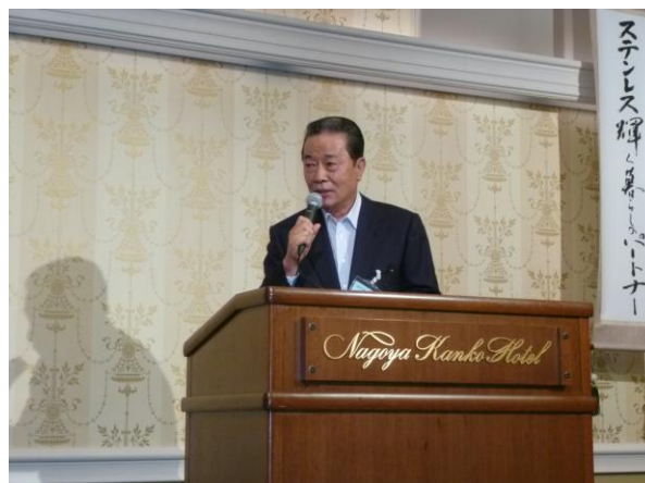
乾杯発声前の挨拶